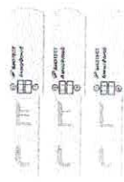
Рис.1 Оценка результатов

Регистрация результатов осуществляется визуально. Оценка результатов проводится в течение 15 минут после внесения образца. Результат после 20 минут считать недействительным.